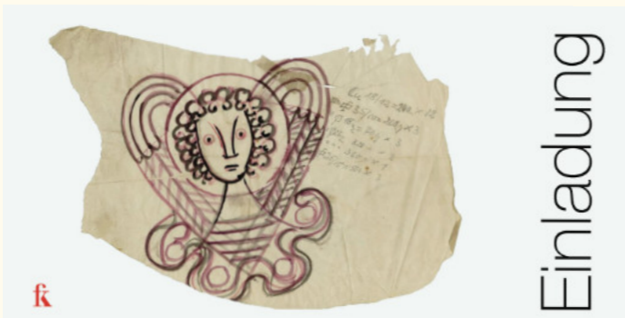
Abb.: Ewald Mataré, Entwurf eines Engels für das Portal der Gedächtniskirche für den Weltfrieden, Hiroshima, 1953/54

Wie in jedem Jahr, so laden wir die Mitglieder des Freundeskreises herzlich zur vorweihnachtlichen Feier ein. Sie findet am Freitag, den 6. Dezember um 19:30 Uhr im Friedrich-Wilhelms-Bad des Museum Kurhaus Kleve statt. Wir treffen uns bei Glühwein, Häppchen, Musik und Bildern des Jahres zum geselligen Beisammensein. Die Einladung per E-Mail oder postalisch erscheint in den nächsten Tagen.