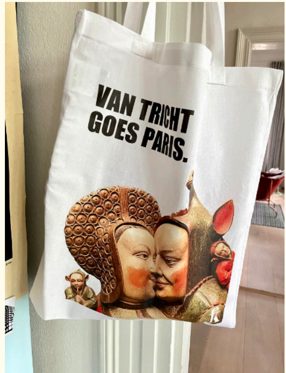
Abb.: Stofftasche mit Arnt-van-Tricht-Motiv, © Hubert Wanders