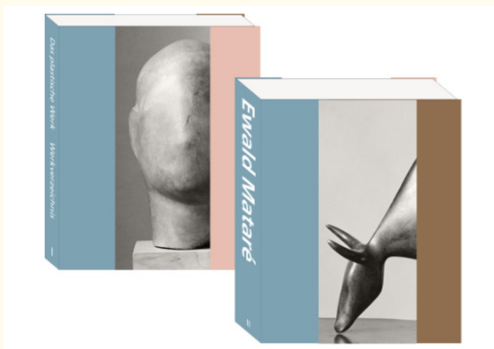
Abb.: Ewald Mataré - Das Plastische Werk, Gestaltung: Tino Grass

Pünktlich zum Ausstellungsbeginn ist das Werkverzeichnis Ewald Mataré - Das plastische Werk im Museumsshop erhältlich. Es handelt sich um ein fulminantes, zweibändiges Nachschlagewerk im Schuber.