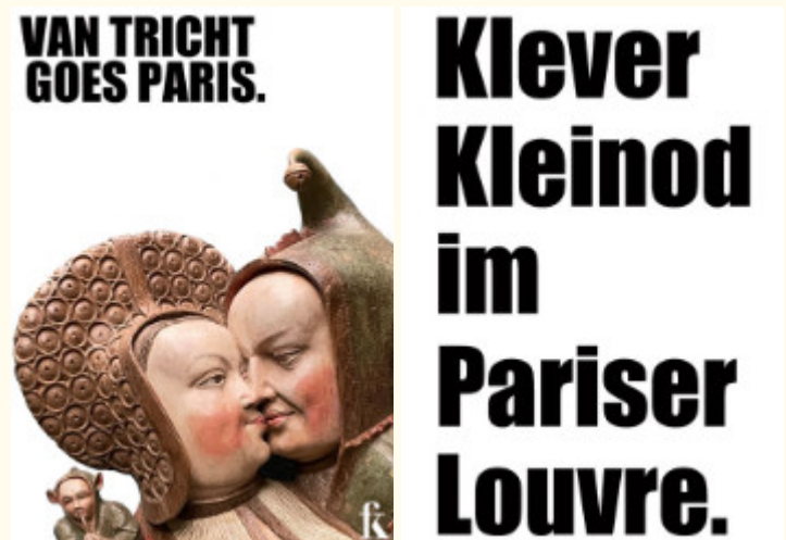
Abb.: Entwurf der Stofftasche, © Hubert Wanders