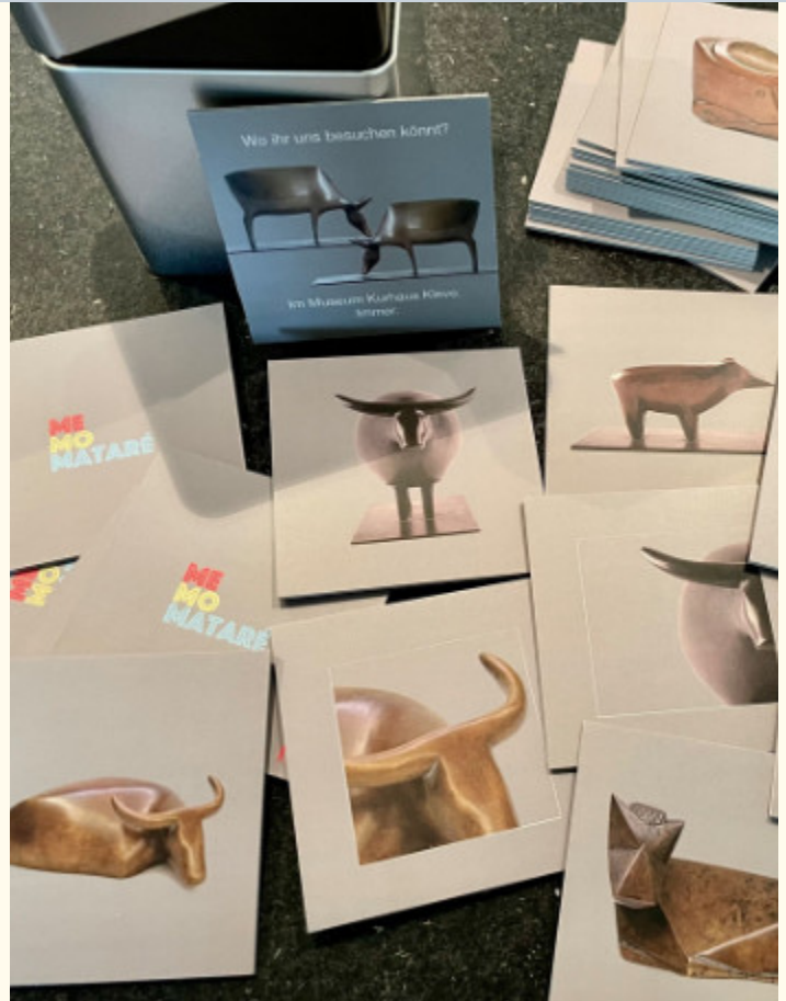
Abb.: MeMoMataré des fk, © Hubert Wanders, Foto: Helga Diekhöfer