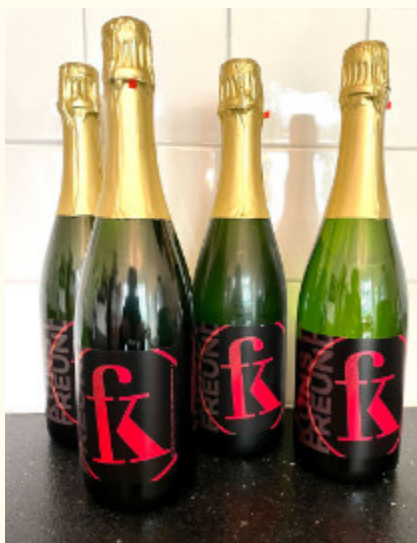
Abb. Sekt-Edition des Freundeskreises

Jetzt schon planen, um an den Festtagen nicht auf dem Trockenen zu sitzen. Wir bieten unsere Sekt-Hausmarke an, die unseren Mitgliedern nicht nur an der Sektbar beim diesjährigen Lichterfest geschmeckt hat, sondern seit nunmehr sechs Jahren eine Erfolgsgeschichte schreibt. Es ist ein badischer Privat Cuvee b.A. Trocken, 2023, 12,0%vol, vom Weinhaus Schwörer in Durbach.