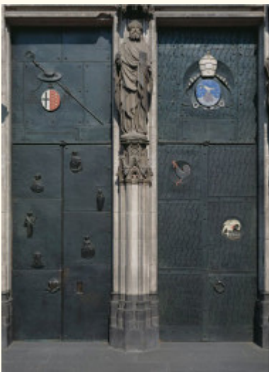
Abb.: Ewald Mataré, Bischofsstür und Papststür , 1947/48, Foto: Kölner Dombauhütte