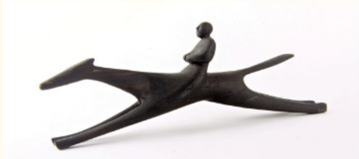
Abb.: Ewald Mataré, Reiter in schnellstem Lauf, 1934 - 1965